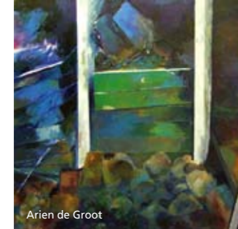
Arien de Groot